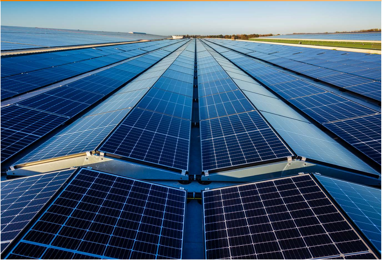
In het zonnetje in de Noordoostpolder: 50.000 m 2 zonnepanelen, goed voor 6 GigaWh/jaar.

een zonnepanelensysteem op 50.000 m 2 dakoppervlakte bij Groenvries BV in Rutten in de Noordoostpolder; goed voor jaarlijks 6 GigaWh/jaar energieopbrengst. "We hebben rond de 25.000 zonnepanelen geplaatst. Van hoge kwaliteit. Hetzelfde geldt voor de montagesystemen. Het is voor ons een vereiste dat de installateurs graag werken met de systemen van Esdec. De montagesystemen zijn betrouwbaar, snel te installeren en voorspelbaar. En dat is prettig voor het bouwteam en goed voor ons."