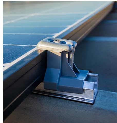
Het ontwerp van het bevestigingssysteem is eenvoudig en maakt snelle montage mogelijk.

Het doel van OneSolar en Agreco is het komende jaar 400.000 tot 500.000 zonnepanelen te plaatsen. Daarvoor hebben zij ongeveer 100 hectare dak nodig. En een indrukwekkende hoeveelheid bevestigingsprofielen. Kroef: "We gaan hard groeien en veel verduurzamen. Het is bijzonder om dat juist te doen met een mooi product als zonnepanelen. Heel mooi om te ondernemen op een maatschappelijk verantwoorde manier."